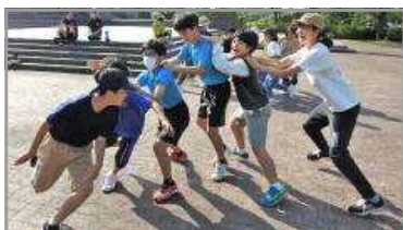
谷山ふるさと歩こう会 5/21 (ふるさと考古歴史館)