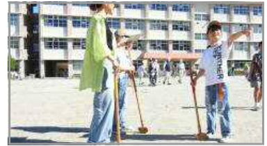
グラウンドゴルフ大会 9/3