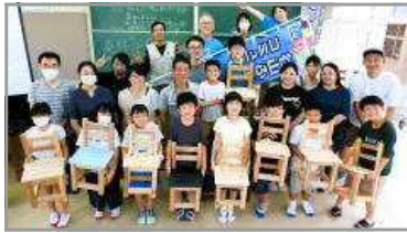
谷山ふるさと寺子屋 7/22 (親子で家具を作ろう)