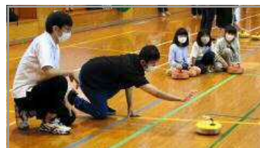
フロアカーリング大会 6/11