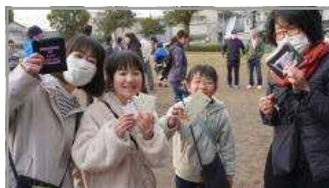
谷山ふるさと歩こう会 2/18 (清見公園)