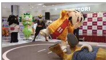
鹿児島キャラ相撲イオン場所 7/15