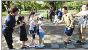
谷山ふるさと歩こう会 9/17 (にわ都市公園)