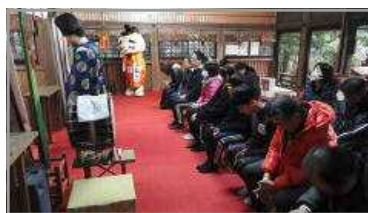
谷山ふるさと歩こう会 1/7