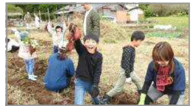
谷山ふるさと自然体験塾 11/12 (さつまいもの収穫&焼き芋大会)