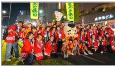
おはら祭 夜まつり 11/2