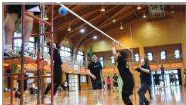
ソフトバレーボール大会 6/18