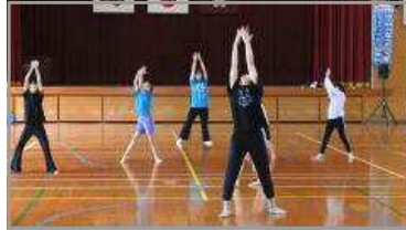
谷山ふるさと寺子屋 10/14 (親子でダンス)