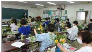
花のある暮らしを楽しもう 6/24, 7/23, 8/19, 10/18, 11/18