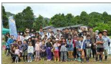
谷山ふるさと自然体験塾 5/28 (まつまいもとスイカの苗を植えよう)