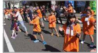
谷山ふるさと祭 総踊り 10/22