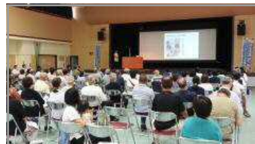
夏の青少年健全育成大会 7/2