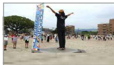
ふれあいラジオ体操 7/22