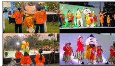
谷山慈眼寺ガラッパまつり 8/19