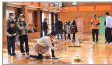
フロアカーリング大会 12/3