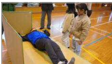
谷山ふるさと寺子屋 2/10・11 (真冬の防災キャンプ)