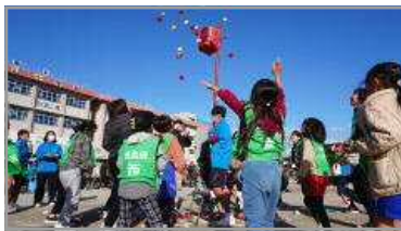
スポーツフェスタ2023 11/19