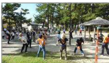
谷山ふるさと歩こう会 7/16 (小松原公園)