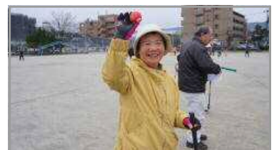
グラウンドゴルフ大会 2/25